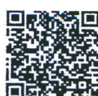
คู่มือธรรมาภิบาล