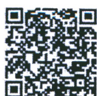
รายงานผล ITA ๖๔