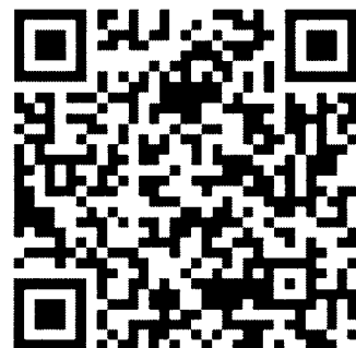
ด้านที่ ๔ การบริการสาธารณะ