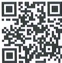
QR Code ๑ ยืนยันการเข้าร่วมฝึกอบรม