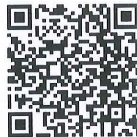
QR Code ๒ ตรวจสอบจำนวนผู้ชำระค่าลงทะเบียนแต่ละรุ่น