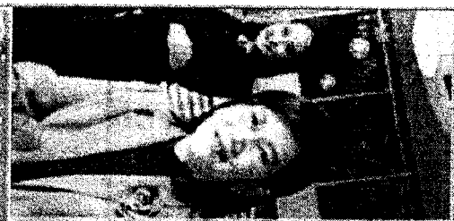
9 ภาพนิ่ง/วีดิทัศน์/เสียง/วิดีโอ