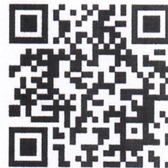
แบบกรอกประวัติ 2 แบบ