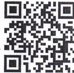
แบบกรอกประวัติ 2 แบบ